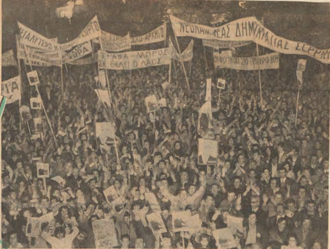
Ένα στιγμιότυπο από την ενθουσιώδη συγκέντρωση των Σερρών στην οποία μίλησε ο 'Ακαδημαϊκός και υποψήφιος βουλευτής 'Επικρατείας της «Νέας Δημοκρατίας» κ. Κων. Τσάτσος.