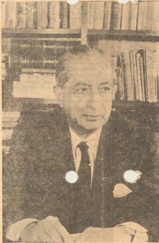
Ο 'Ακαδημαϊκός κ. Κωνσταντίνος Τσάτσο