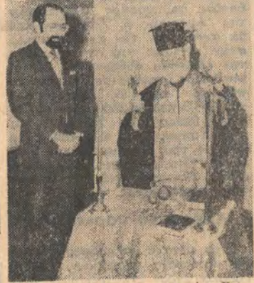
Ευάγγελος τού έγκρίνει τού νέου Έκ...