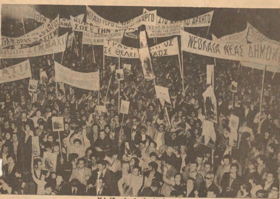
Επίδειξι όπαδών Χιλιάδες λαού με πλακάτ στην συγκέντρωσι τών Σερρών όπου μίλησε ό κ. Κων. Τσάτσος

ΟΜΙΛΙΕΣ ΤΟΥ κ. ΚΩΝ. ΤΣΑΤΣΟΥ ΣΕ ΟΓΚΩΔΕΙΣ ΣΥΓΚΕΝΤΡΩΣΕΙΣ ΣΤΗΝ ΠΡΩΤΗ, ΔΡΑΜΑ, ΣΕΡΡΑΣ