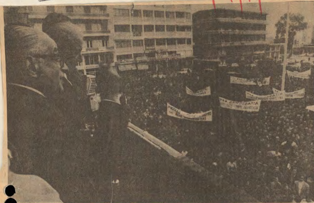
Από την ένθουσιώδη υποδοχή που επέφύλαξε ο λαός της Πιερίας στον κ. Τσάτσο στην Κατερίνη